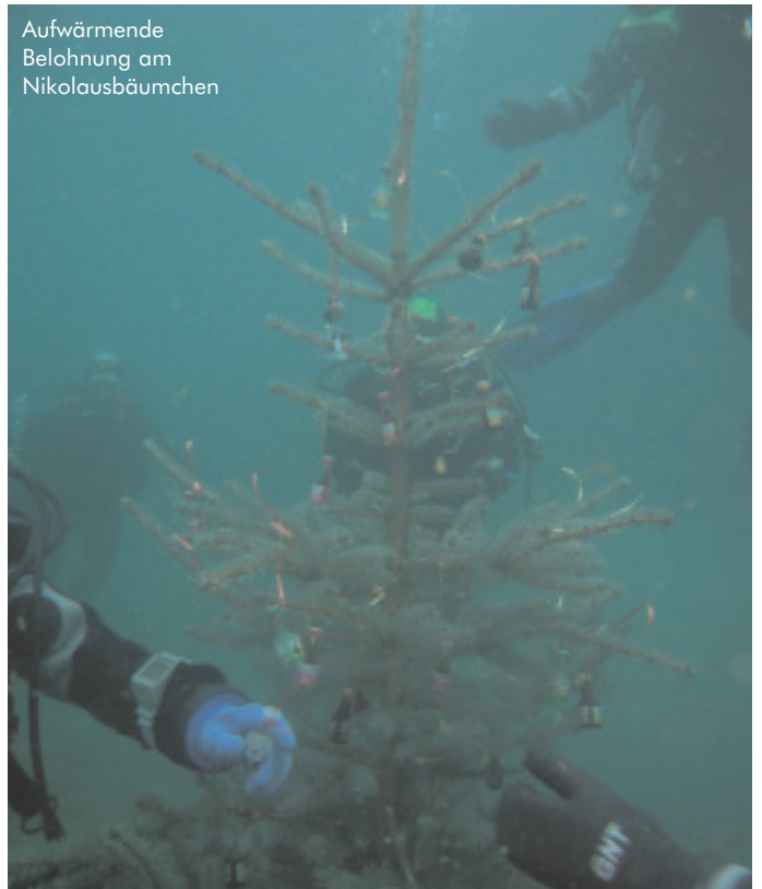
Aufwärmende Belohnung am Nikolausbäumchen