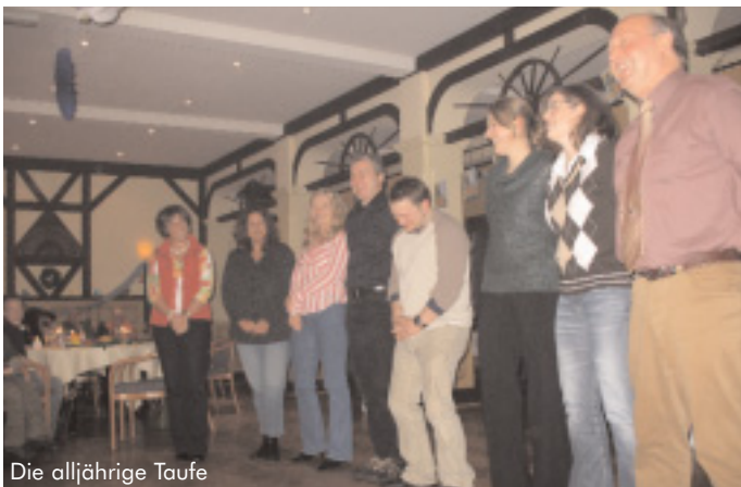
Die alljährige Taufe