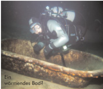
Ein wärmendes Bad?